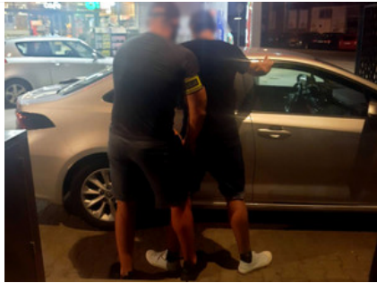
Kolejny sukces północnopraskich "Skorpionów" - zatrzymani do kradzieży suzuki na Bemowie