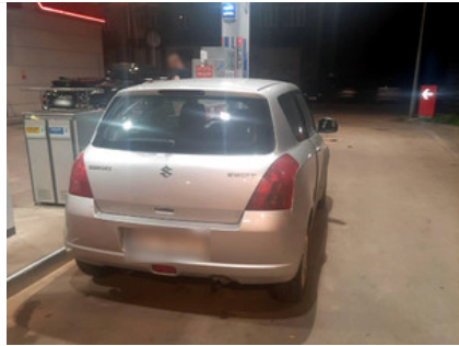
Kolejny sukces północnopraskich "Skorpionów" - zatrzymani do kradzieży suzuki na Bemowie