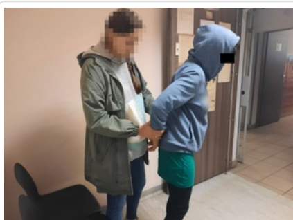
Policjantka zakłada kajdanki zatrzymanej kobiecie

44-latka była w zainteresowaniu sądów, prokuratury i Policji. Jej poszukiwania prowadzili policjanci z Tłuszcza ale też kryminalni z Targówka. Kobieta miała orzeczoną karę pozbawienia wolności m.in. za nieuregulowaną grzywnę. Ponieważ nie miała stałego miejsca pobytu, jej zatrzymanie było utrudnione. Jednak determinacja dzielnicowych z Pragi Północ zaowocowała zatrzymaniem kobiety w jej tymczasowej kryjówce. I nawet to, że poszukiwana w trakcie legitymowania podawała dane swojej siostry, nie uchroniło jej przed aresztem śledczym.