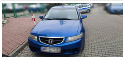
pojazd, którym poruszali się zatrzymani

Była godzina 11.30 kiedy załoga patrolowo - interwencyjna z komisariatu na Białołęce została wezwana na ulicę Milenijną. Tam oczekiwał na mundurowych zgłaszający z ujętym przez siebie obcokrajowcem.